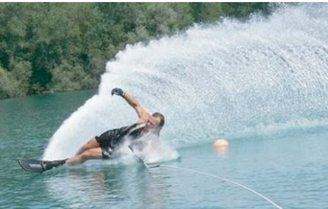
leisure time pleasure water skiing