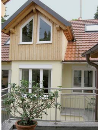
Языковой Пансион Столовая